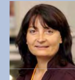
Verwaltung, Finanzen, Qualität