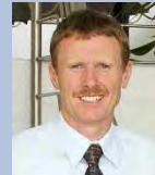
Vertrieb- und Projekt